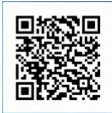
Apple Store (iPhone)

De app is gratis en vind je terug in de Play Store of Apple Store onder de naam 'Parole' of scan de QR-codes