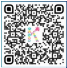
Play Store (Android)

De taalachterstand van kinderen wordt groter door de huidige coronacrisis. Kinderen hebben minder contacten en zijn vaker thuis. Daardoor vallen ze sneller terug op hun moedertaal. Anderstalige ouders kunnen via deze app hun kind helpen om de Nederlandse taal onder de knie te krijgen.